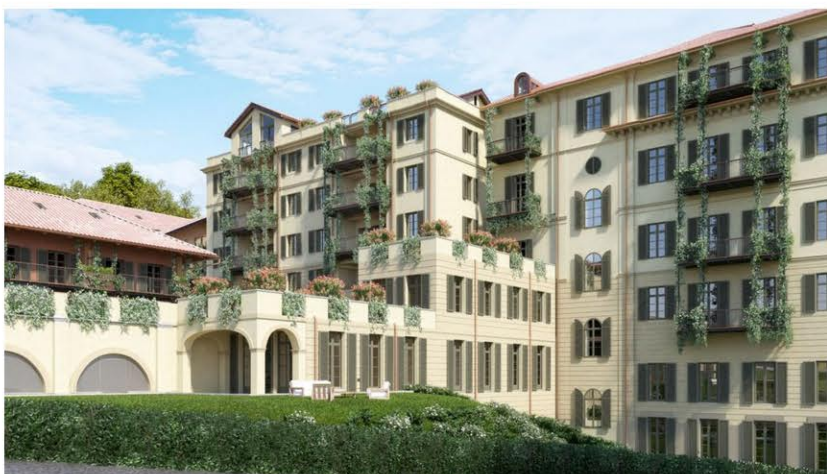
Gli appartamenti sono ampi e dotati di terrazzo, immersi in un parco secolare.

«Thovez11 è un'operazione da 50 milioni di euro che nasce dall'idea di realizzare la casa per chi sceglie di non rinunciare a nulla. L'intervento si trova sopra al centro in una posizione privilegiata, che offre una delle più incantevoli viste sulla città e al tempo stesso la comodità per tutti i servizi, scuole, negozi e mezzi pubblici. Si tratta di un recupero immobiliare di ultima generazione, in linea con le nuove filosofie di rispetto del territorio e dell'ambiente».