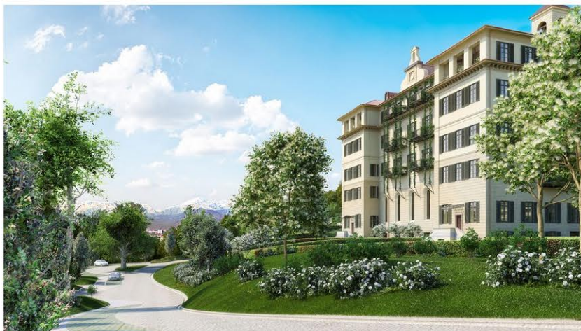
Il complesso residenziale Thovez11 sarà pronto a dicembre 2018.