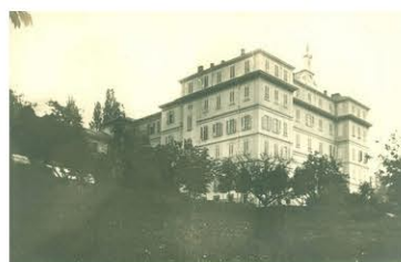
Com'era | L'Istituto delle Suore del Sacro Cuore, Crimea, Torino.

L'edificio è stato recuperato e trasformato preservando le forme dell'architettura originaria: la trasformazione dell'antica scuola nel complesso abitativo contemporaneo segue linee di profondo rispetto dell'ambiente e della natura utilizzando terreno già esistente ed evitando il consumo di nuovo suolo .